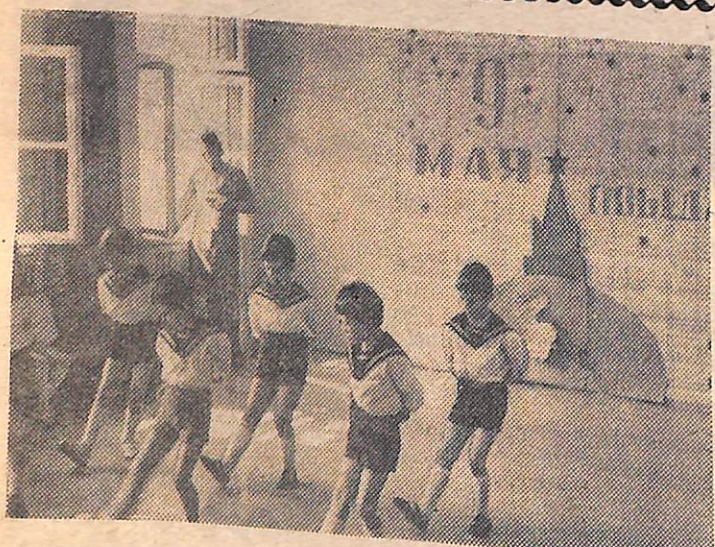
Весело встречают праздники дети Советской страны. На снимке: танец моряков исполняют ребята из детского сада № 13.